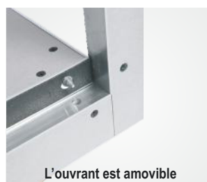
L'ouvrant est amovible