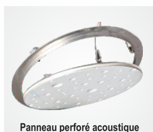
Panneau perforé acoustique